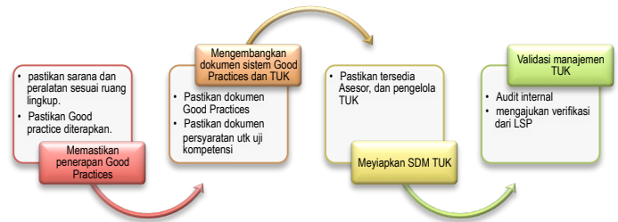
SOP mengembangkan TUK